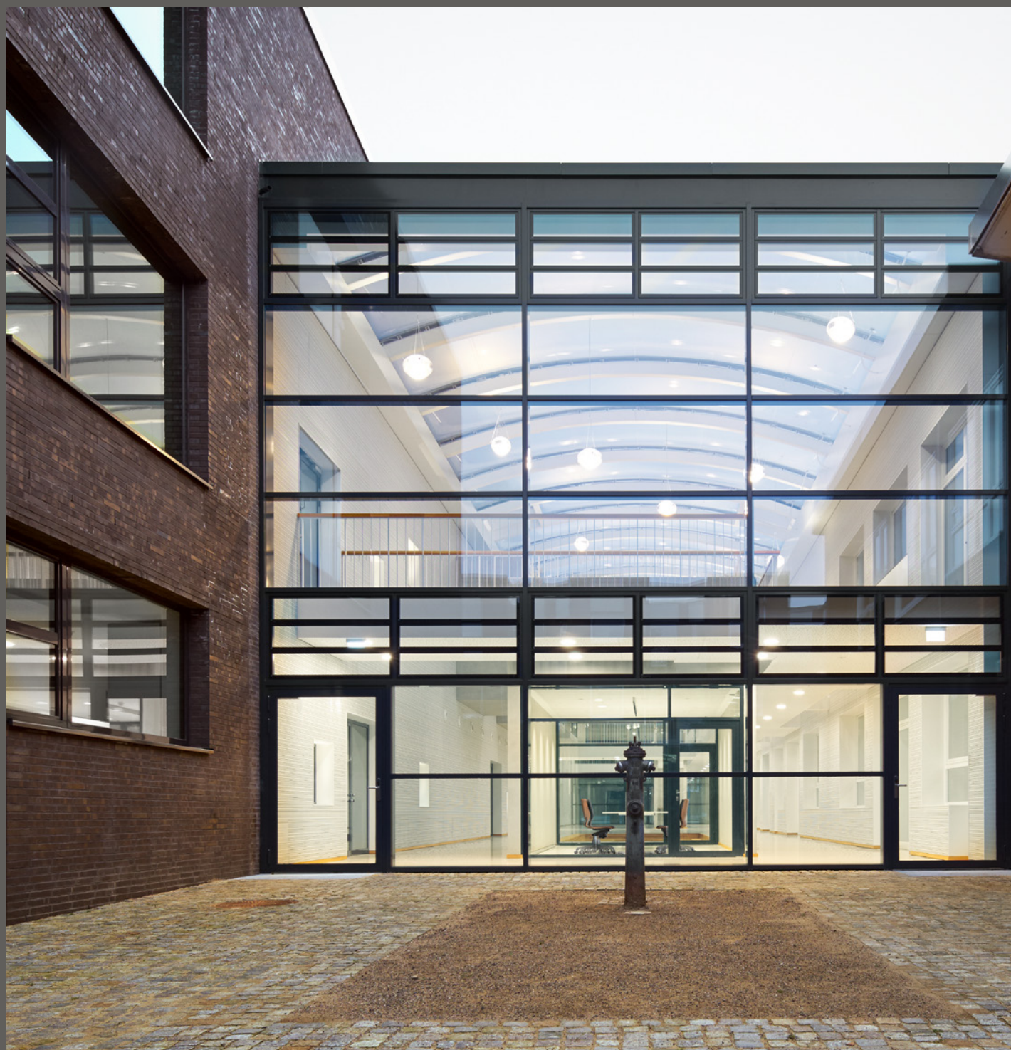
ST. PAULUS SCHULE, HAMBURG