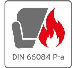
Optional brandschutzzertifiziert nach DIN 66084 P-a mit Bezugstoff B1