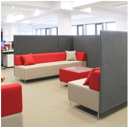
Durch verkettbare Elemente individuell erweiterbar