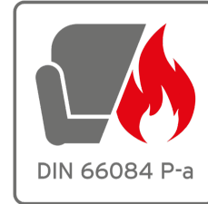
Optional brandschutzzertifiziert nach DIN 66084 P-a mit Bezugsstoff B1