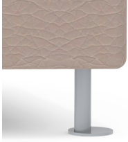
Stabiles Rundrohrgestell optional verchromt