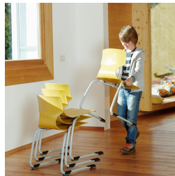
Bis zu 5 Stühle stapelbar (ohne Polster)