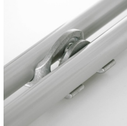
Optional mit Reihenverbindung ab Größe 5