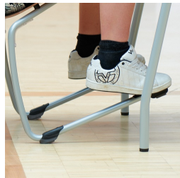
Robustes C-Form Gestell mit ASS FLOORSAFE® Bodenschoner