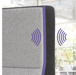
Schallschutz durch schallabsorbierenden Schaumstoff in Rückenlehne