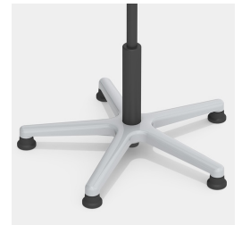
Absolut robustes Alu-Fußkreuz