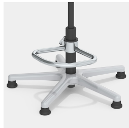
Optional mit Teilfußring