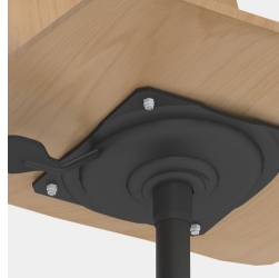
Höhenverstellung durch Sicherheitsgasfeder