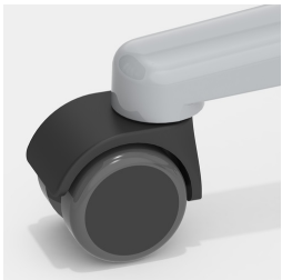
Optional mit lastabhängig gebremsten Rollen