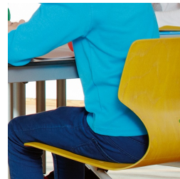
Ergonomisch und orthopädisch angepasste Schalenform