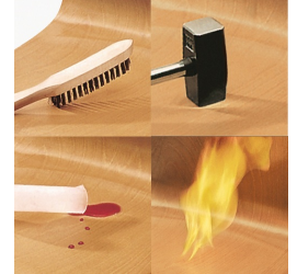
Unverwüstliche PAGHOLZ®-Schale, kratz-, bruch-, stoßfest und hitzebeständig