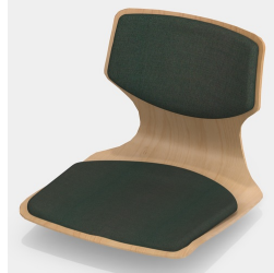
Optional mit Sitz- und Rückenpolster (nur Gr. 6E, 7)