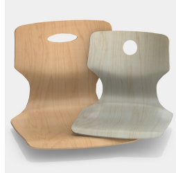
Optional mit Griffloch, rund oder oval