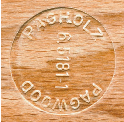
PAGHOLZ® aus nachhaltiger Forstwirtschaft