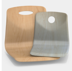
Optional mit Griffloch, rund oder oval (nicht mit Rückenpolster)