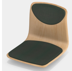
Optional mit Sitz- und Rückenpolster (nur Gr. 6E, 7)