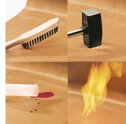
Unverwüsthliche PAGHOLZ®-Schale, kratz-, bruch-, stoßfest und hitzebeständig