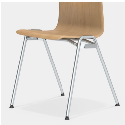
Robustes 4-Bein Gestell