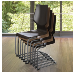
Bis zu 5 Stühle stapelbar (ohne Polster)