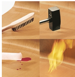
Sitz und Rücken melaminharzbeschichtet: kratz-, bruch-, stoßfest & schwer entflammbar