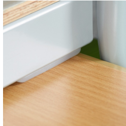
Plattenschoner schützen den Tisch beim Aufstuhlen