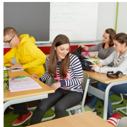
Kein Stören der Stuhlbeine beim Ein- und Aussteigen