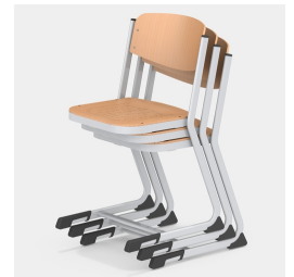
Bis zu 3 Stühle stapelbar (Gr. 7)