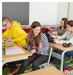
Kein Stören der Stuhlbeine beim Ein- und Aussteigen