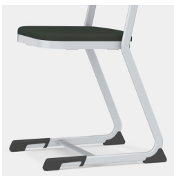
Stabiles und massives C-Form Kufengestell