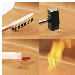
Sitz und Rücken melaminharzbeschichtet: kratz-, bruch-, stoßfest & schwer entflammbar