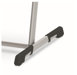
Bodenschoner mit integriertem Trittschutz