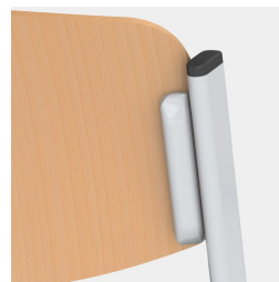
Sitz und Rücken verdeckt verschraubt