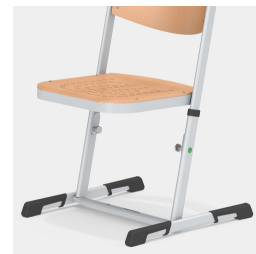
Stabiles, höhenverstellbares Kufengestell