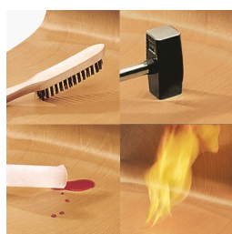
Sitz und Rücken melaminharzbeschichtet: kratz-, bruch-, stoßfest & schwer entflammbar