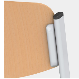
Sitz und Rücken verdeckt verschraubt