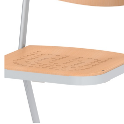
Sitzfläche mit eingepressten, rutschhemmenden Noppen