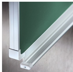
Passende Ablageleiste für Kreide und Stifte