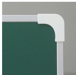
Kantenschutz durch gerundete „Sicherheitsecken“