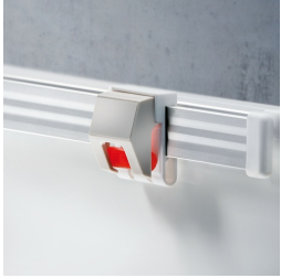
Optional mit Bilderklemmleiste