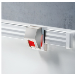
Optional mit Bilderklemmleiste