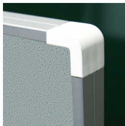
Kantenschutz durch gerundete „Sicherheitsecken“