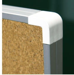
Kantenschutz durch gerundete „Sicherheitsecken“