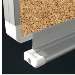
Passende Ablageleiste für Kreide und Stifte