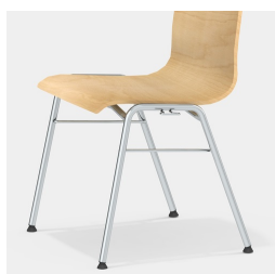
Robustes 4-Bein Gestell