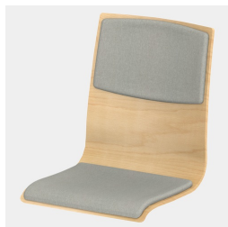
Optional mit Sitz- und Rückenpolster