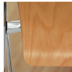
Sitzschale umweltfreundlich lackiert mit Lack auf Wasserbasis