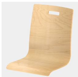
Optional mit rechteckigem Griffloch (nicht mit Rückenpolster)