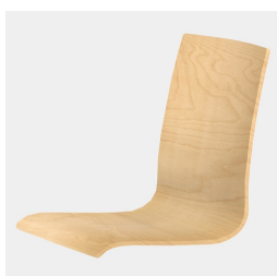
Körpergerecht geformte Sitzschale