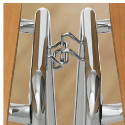
Gestell inklusive Reihenverbindung