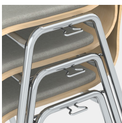
Bis zu 9 Stühle stapelbar (auch mit Sitzpolster)