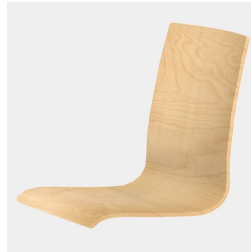
Körporgerecht geformte Sitzschale