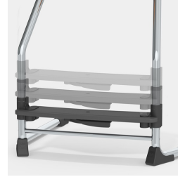
Werkzeuglose Verstellung der Fußraste mit nur einer Hand