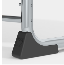
Kippschutz durch spezielle Bodenschoner