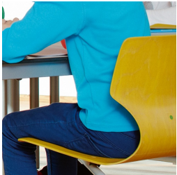
Ergonomisch und orthopädisch angepasste Schalenform