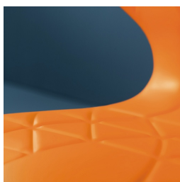
Sitzschale mit integrierten Lüftungskanälen