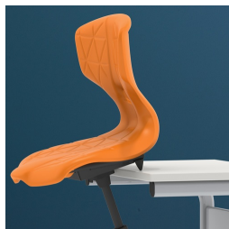
Tischaufhängung schützt den Tisch beim Aufstuhlen