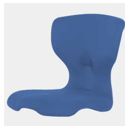
Optional Sitzschale Vollpolster ab Größe 5