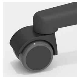
Optional mit lastabhängig gebremsten Rollen