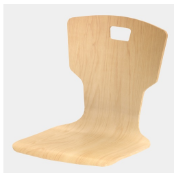
Optional mit Griffloch in Trapezform (nicht mit Rückenpolster)