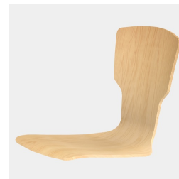
Körpergerecht geformte Sitzschale