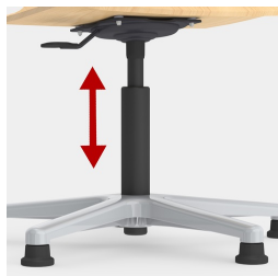
Höhenverstellung durch Sicherheitsgasfeder