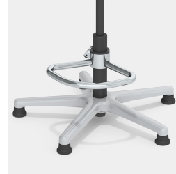
Optional mit Teilfußring