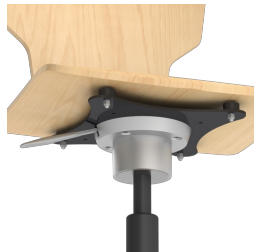
Optional mit 3D-Wippe