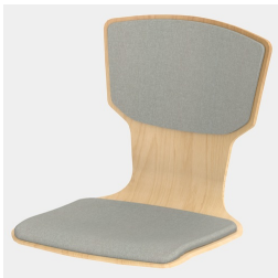
Optional mit Sitz- und Rückenpolster