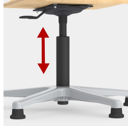
Höhenverstellung durch Sicherheitsgasfeder