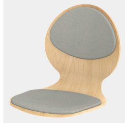
Optional mit Sitz- und Rückenpolster