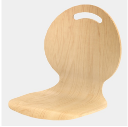
Optional mit Griffloch in Nierenform (nicht mit Rückenpolster)