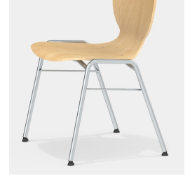
Robustes 4-Bein Gestell