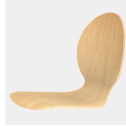
Körpergerecht geformte Sitzschale