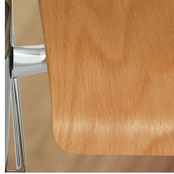
Sitzschale umweltfreundlich lackiert mit Lack auf Wasserbasis