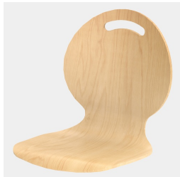
Optional mit Griffloch in Nierenform (nicht mit Rückenpolster)