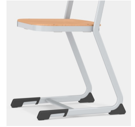
Stabiles und massives C-Form Kufengestell