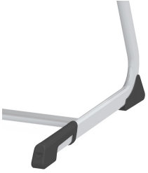
Bodenschoner mit integriertem Trittschutz