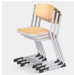
Bis zu 3 Stühle stapelbar (Gr. 7)