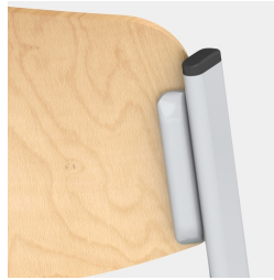
Sitz und Rücken verdeckt verschraubt