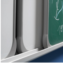
Tafel-Elemente mit ASSODUR®-Kante hintereinander verschiebbar