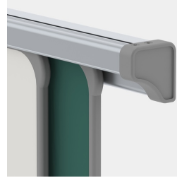
Kunststoffkappen verhindern unbeabsichtigtes Herausstoßen