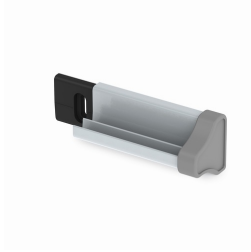
Unsichtbare Schienen-Befestigung gleicht Wandunebenheiten aus