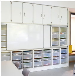
Montierbar an Schrankwand