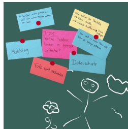
Magnethaftende Oberfläche mit Kreide beschreibbar