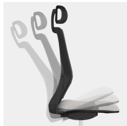
Selbstwiegende Synchronmechanik passt Federkraft bzw. Widerstand automatisch an