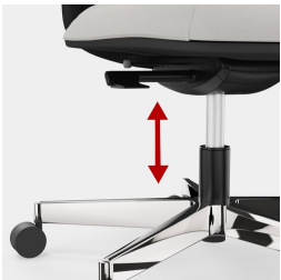
Stufenlose Gaslifthöhenverstellung inkl. Sitztiefenfederung