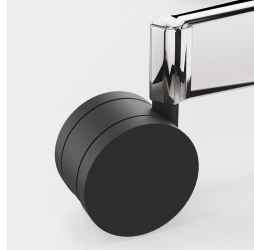
Lastabhängig gebremste Sicherheitsrollen verhindern ungewolltes Wegrollen