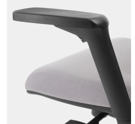
Armlehne dreidimensional verstellbar