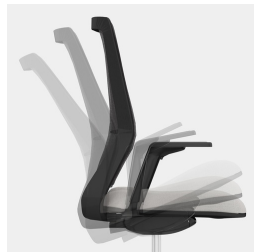
Selbstwiegende Synchronmechanik passt Federkraft bzw. Widerstand automatisch an