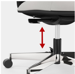
Stufenlose Gaslifthöhenverstellung inkl. Sitztiefenfederung