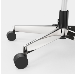
Elegantes, hochwertiges Alu-Fußkreuz