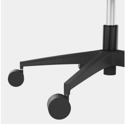
Elegantes, stabiles Kunststoff-Fußkreuz in schwarz