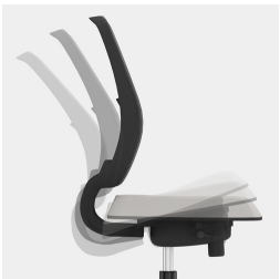
Synchronmechanik: Federkraft bzw. Widerstand an Körpergewicht anpassbar