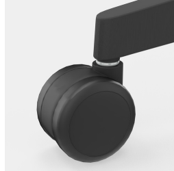
Lastabhängig gebremste Sicherheitsrollen verhindern ungewolltes Wegrollen