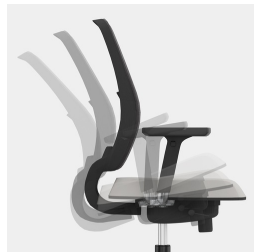
Synchronmechanik: Federkraft bzw. Widerstand an Körpergewicht anpassbar