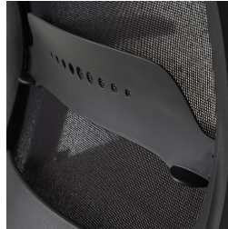
Netzrückenlehne schwarz, mit Lordosenstützverstellung