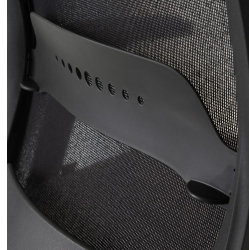
Netzurückenlehne schwarz, mit Lordosenstützverstellung