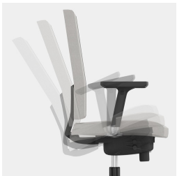
Synchronmechanik: Federkraft bzw. Widerstand an Körpergewicht anpassbar