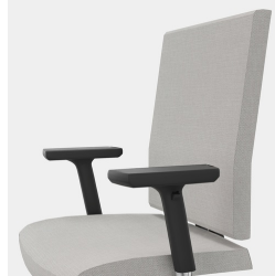
Ergonomisch geformte Rückenlehne