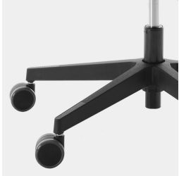
Elegantes, stabiles Kunststoff-Fußkreuz in schwarz