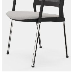
Robustes 4-Bein Gestell