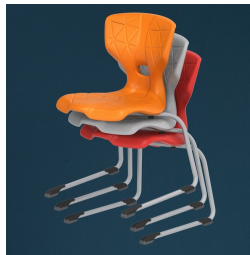
Bis zu 3 Stühle stapelbar (ohne Polster)