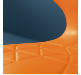
Sitzschale mit integrierten Lüftungskanälen