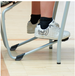
Robustes C-Form Gestell mit ASS FLOORSAFE® Bodenschoner