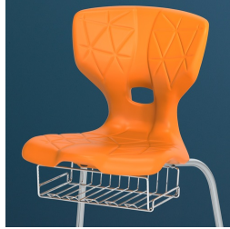
Optional mit Buchablagekorb ab Größe 5