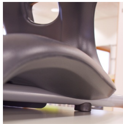
Plattenschoner schützen den Tisch beim Aufstuhlen