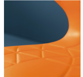
Sitzschale mit integrierten Lüftungskanälen