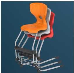
Bis zu 3 Stühle stapelbar