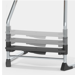
Werkzeuglose Verstellung der Fußbraste mit nur einer Hand