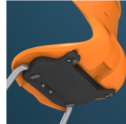
Verdeckte Sitzschalen-Befestigung schützt den Tisch beim Aufstuhlen