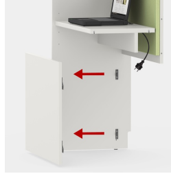
Blende abnehmbar zur einfachen Kabelführung