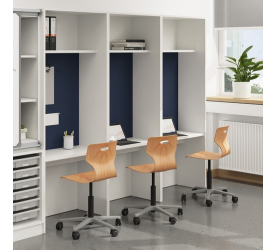
Seitenwände für besseren Blend- und Sichtschutz