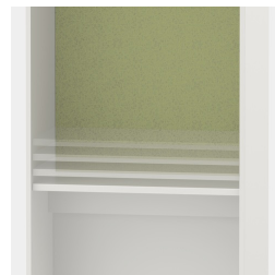
Tischplatte höhenverstellbar; Kabeldurchlass optional