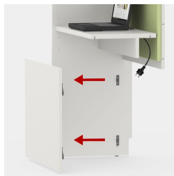
Blende abnehmbar zur einfachen Kabelführung