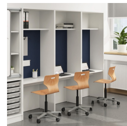
Seitenwände für besseren Blend- und Sichtschutz