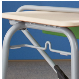
Stapelsteg mit Mappenhaken beidseitig