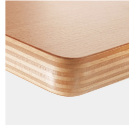
Optional Tischplatte Multiplex melaminharzbeschichtet