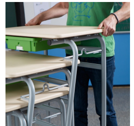
Bis zu 4 Tische stapelbar, auch mit Zubehör