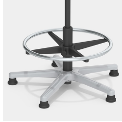
Robustes Alu-Fußkreuz mit Erhöhung und verchromtem Fußring, höhenverstellbar