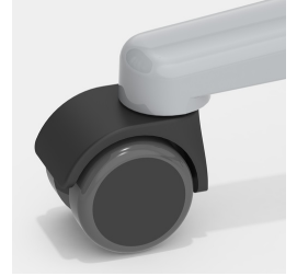
Optional mit lastabhängig gebremsten Rollen