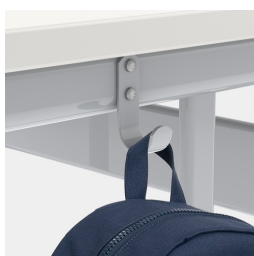
Inklusive einem Mappenhaken je Sitzplatz