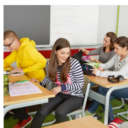
Durch C-Form kein Stören der Tischbeine beim Ein- und Aussteigen