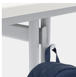
Inklusive einem Mappenhaken pro Sitzplatz