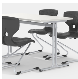
Durch Mittelsäulengestell beidseitig bestuhlbar