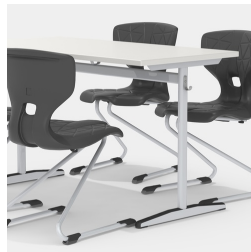
Durch Mittelsäulengestell beidseitig bestuhlbar