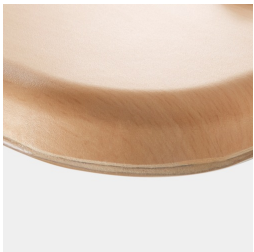
Optional WOODMARK Tischplatte in bruchfester Qualität