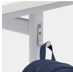
Inklusive einem Mappenhaken pro Sitzplatz