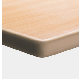
Optional Tischplatte melaminharzbeschichtet mit ASSODUR®-Kante