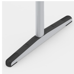
Bodenschoner mit durchgehendem Trittschutz