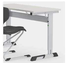
Durch C-Form kein Stören der Tischbeine beim Ein- und Aussteigen