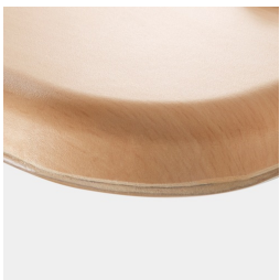
Optional WOODMARK Tischplatte in bruchfester Qualität