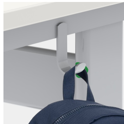
Inklusive einem Mappenhaken je Sitzplatz