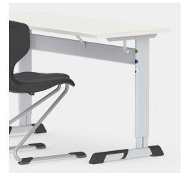
Durch C-Form kein Stören der Tischbeine beim Ein- und Aussteigen